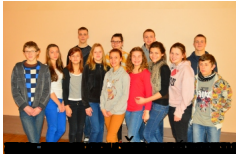
2011.gada 05. decembrī no protokola Nr. 15